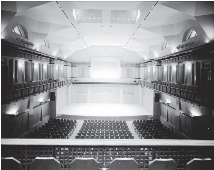
SAITAMA ARTS THEATER, CONCERT HALL